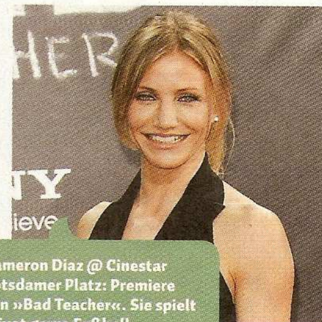
Cameron Diaz @ Cinestar Potsdamer Platz: Premiere von »Bad Teacher«. Sie spielt privat gerne Fußball.